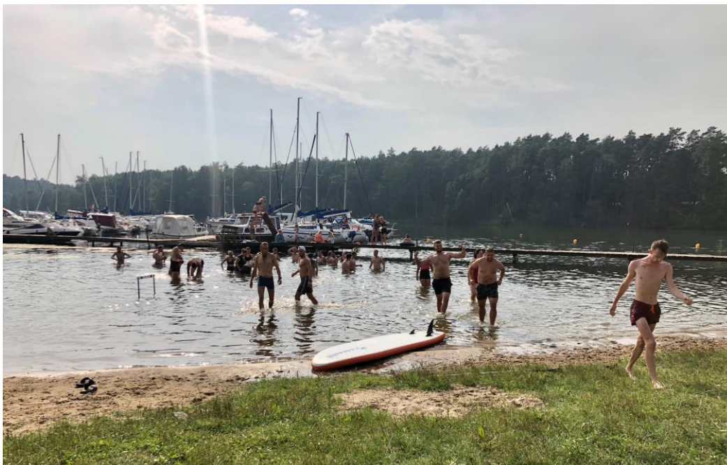
Foto 9. Zajęcia na obozie letnim

Praktyczne elementy wychowania fizycznego, realizowane są dodatkowo, podczas letniego i zimowego obozu sportowego.