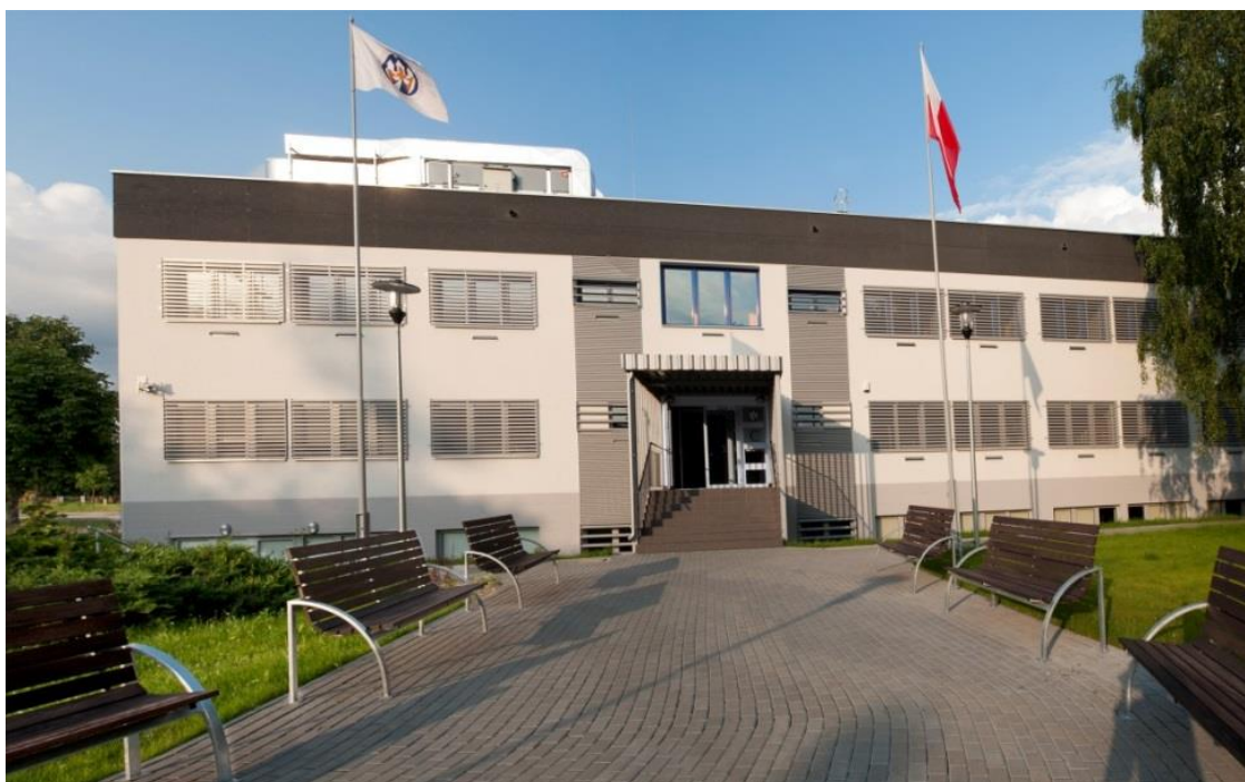
Foto2. Budynek główny część C