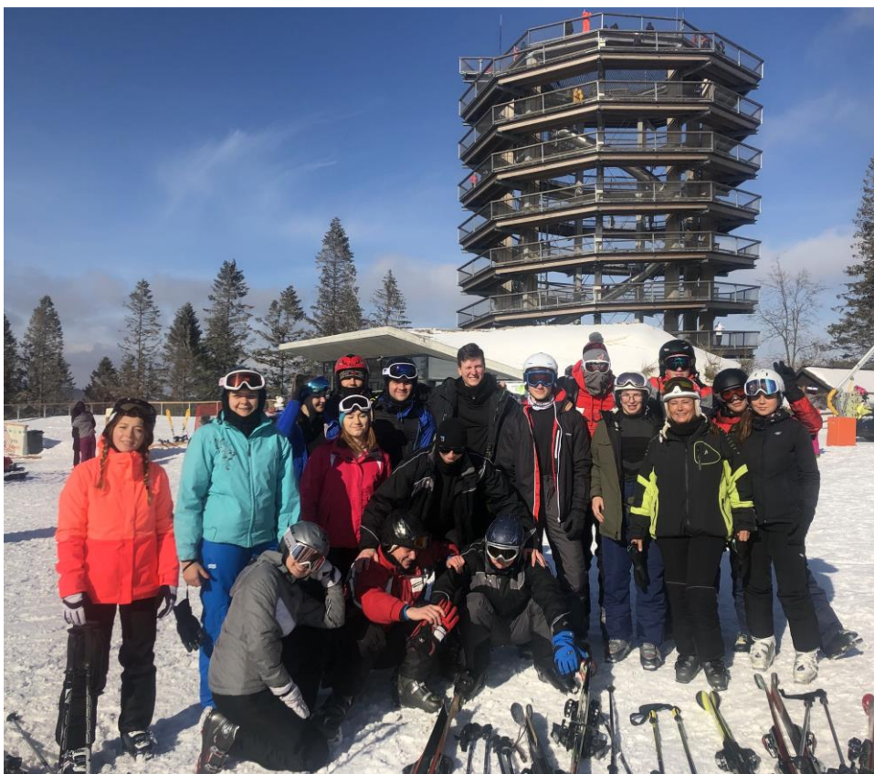
Foto 10. Zajęcia na obozie zimowym